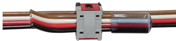
写真：TM4-BRG-54B-50P (1.25sqフラットケーブル分岐)